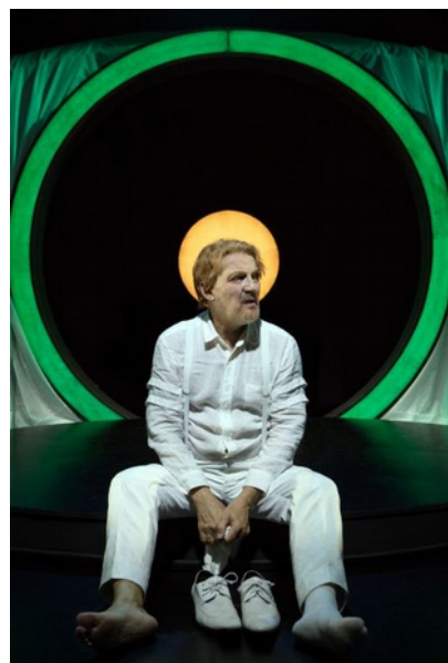
Preben Kristensen